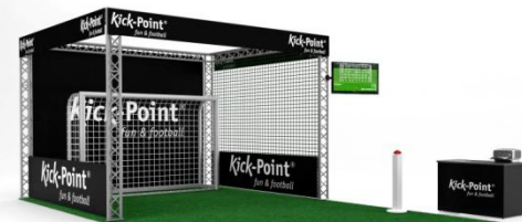
Branding-Beispiel Variante C